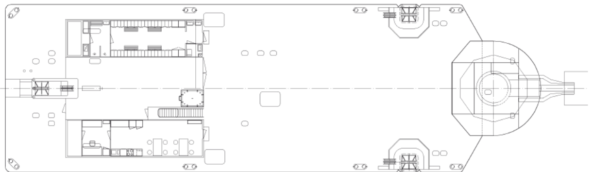
ПАЛУБА – ВИД СВЕРХУ