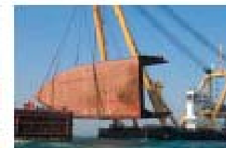
УДАЛЕНИЯ ОБЛОМКОВ КОРАБЛЕКРУШЕНИЯ