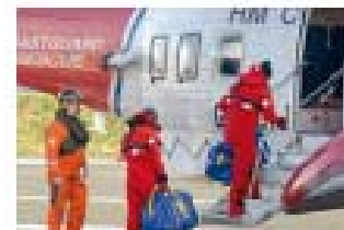
ЛИКВИДАЦИИ ЧРЕЗВЫЧАЙНЫХ СИТУАЦИЙ